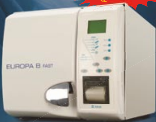
→ Europa B Fast