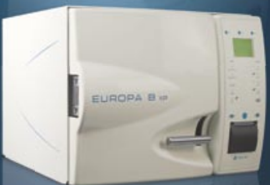
→ Europa B XP