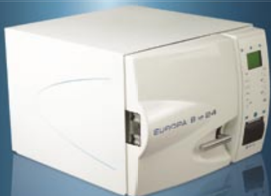
→ Europa B XP 24