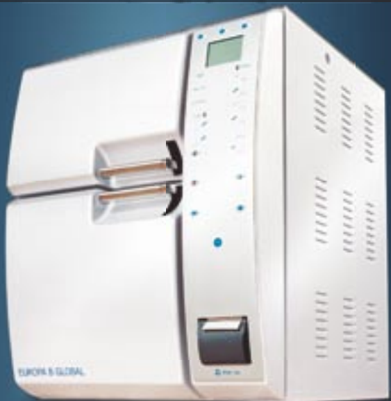
→ Europa B Global